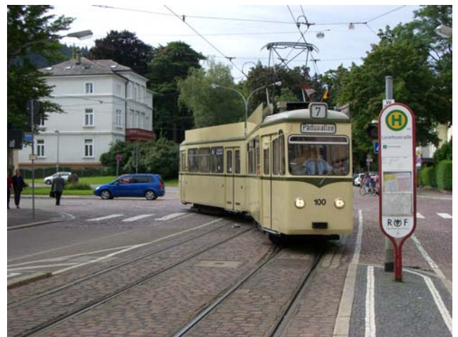
07.07.2007 · Haltestelle Lorettostr. (SL2) : Ausfahrt von GT4 100 (ex103) „Sputnik“ aus dem Betriebshof SÜD auf die Oldtimerlinie 7 am Tag der FdFS eXpo 2007.

der Monate Mai bis September. Die genauen Fahrplandaten können dem anhängenden Fahrplan, Seite 2 dieser Ausgabe des FdFS e-X-press, entnommen werden. Zudem ist der Fahrplan auch wieder im VAG Taschenfahrplanheft verfügbar. Die Mitfahrt auf der Oldtimerlinie 7, ist generell kostenfrei. Spenden für den Erhalt des historischen Fahrzeugparks sind jedoch herzlich willkommen. Gegen die Mindestspende von € 2.- kann auch wieder ein jeweils für den Betriebstag limitierter Sonderfahrchein bei den Schaffnern erworben werden. Zm Einsatz kommen am 03. Mai TW45 (Bj.1914) und GT4 100 „Sputnik“ (Bj.1959). Das FdFS Tram Café verkehrt nicht.